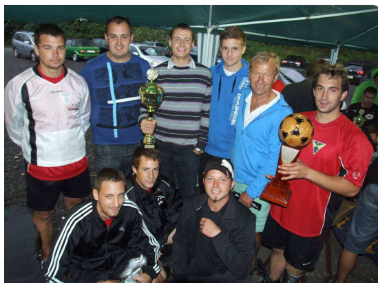
Sieger des Gemeindefußballturniers 2011, „HC Kreams“

Die gesamten Ergebnisse findet man auf unserer Homepage.