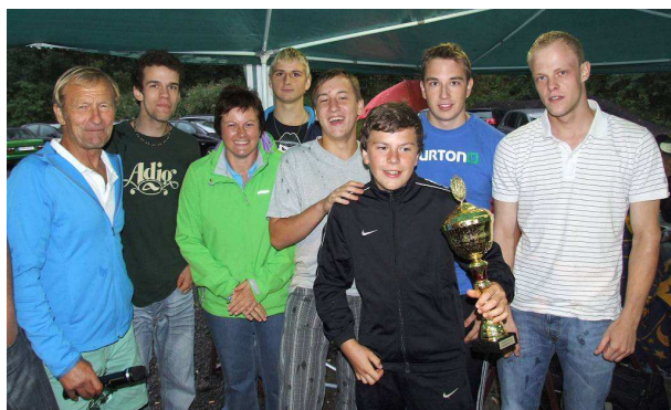
Dritter Platz, „Landjugend Lieser Maltatal“