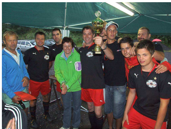
Zweiter Platz, „FC Dream Team“